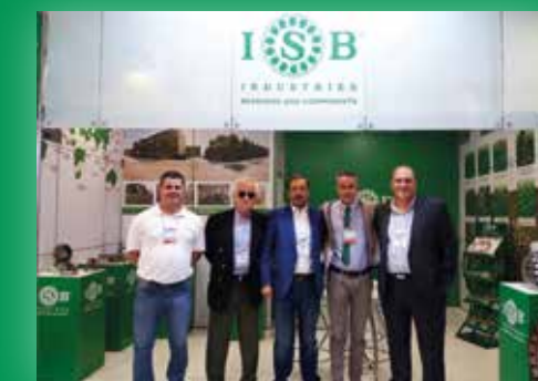
In alto, la sede di ISB CENTRO AMERICA. A sinistra, la sede di ISB BRASIL. A destra, lo staff ISB presente al FEIMEC.