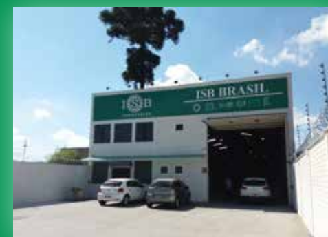
Above, ISB CENTRO AMERICA Headquarter. On the left, ISB BRASIL Headquarter. On the right, ISB staff at FEIMEC.

ting and communication. ISB attends, in fact, in numerous trade fairs with the support of local staff. Through its branches, in 2018 ISB took part in FIMA (Zaragoza, Spain), the trade fair dedicated to agricultural machinery and FEIMEC (São Paulo, Brazil), focused on the manufacturing sector. The next events will be BEARING EXPO and BAUMA (Shanghai, China) and BAUMA GURGAON (Gurgaon, India). The presence of ISB Service and its branches in the world is becoming increasingly important. In the next few months other "green points" will, in fact, be opened, with the aim of making ISB one of the most important brand in the international market.